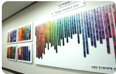
Image & Color Education